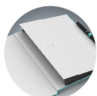
Pochette de rangement